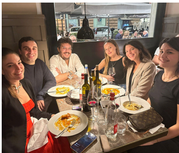
11 ottobre 2023 Assemblea e Cena Sociale AIGA Roma