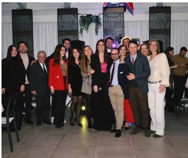
20 dicembre 2023 Festa di Natale AIGA Roma