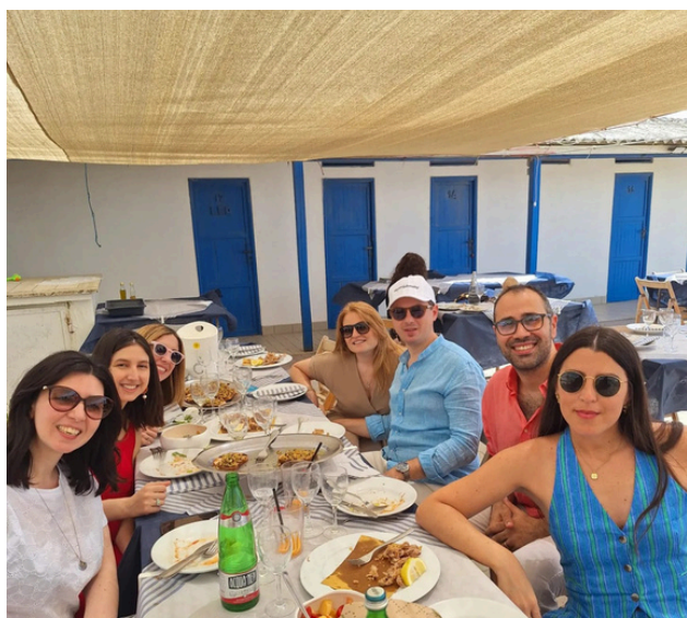
8 giugno 2024 Pranzo sociale