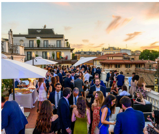
5 luglio 2023 Festa Estiva AIGA Roma